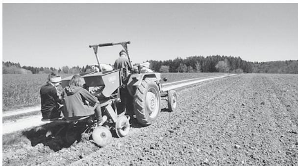
„Heute noch wie damals“ - Erdäpfel (Kartoffeln) legen in Premerzhofen/Schmidhof bei Breitenbrunn.