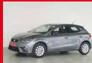
SEAT Ibiza Xcellence 1.6 TDI, 70 kW (95 PS)

EZ 07.2018, 17.145 km , Abstandstempomat, DAB-Radio, Einparkhilfe, Induktionsladen für Smartphones, LED-Scheinwerfer, Leichtmetallfelgen, Multifunktionslenkrad, Navi, Alcantara uvm.