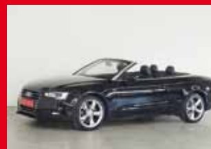
Audi A5 Cabrio quattro 2.0 TDI, 140 kW (190 PS)

EZ 05.2016, 8.770 km , Allrad, S-Line, Bi-Xenon-Licht, Einparkhilfe, Leichtmetallfelgen, Multifunktionslenkrad, Navi, Polster/Teilleider, Sitzheizung, Sportfahrwerk, bluetooth uvm.