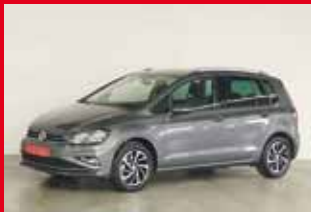
Golf Sportsvan Join 1.0 TSI, 85 kW (116 PS)

EZ 09.2018, 1.500 km , Einparkhilfe, Fernlichtassistent, Leichtmetallfelgen, Multifunktionslenkrad, Navi, Nebelscheinwerfer, Sitzheizung, bluetooth, Licht-/Regensensor uvm.