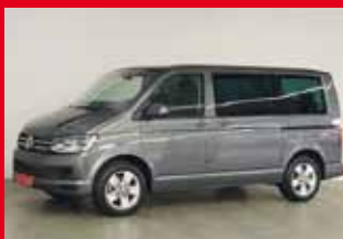
VW Multivan 2.0 TDI DSG, 110 kW (150 PS)

Schlehenring 22 | 85135 Titting | Telefon: 08423 - 98 57 00 | Fax: 08423 - 98 57 02