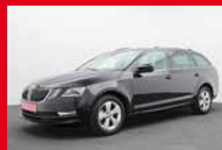
Skoda Octavia Combi Style 1.6 TDI, 85 kW (116 PS)

EZ 04.2019, 23.730 km , Abstandstempomat, beheizb. Frontscheibe, Einparkhilfe, elektr. Heckklappe, LED-Scheinwerfer, Lenkradheizung, Navi, Polster/Teilleider, Sitzheizung, Virtual Cockpit uvm.