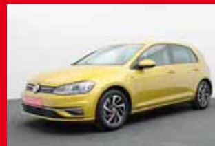
VW Golf VII Join 1.5 TSI, 96 kW (131 PS)

EZ 12.2018, 25.440 km , Abstandstempomat, Einparkhilfe, Fernlichtassistent, Klimaautomatik, Leichtmetallfelgen, Multifunktionslenkrad, Navi, Sitzheizung uvm.