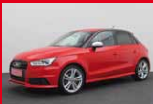
Audi S1 Sportback quattro 2.0 TFSI, 170 kW (231 PS)

>> Ihr zuverlässiger Partner rund ums Haus <<