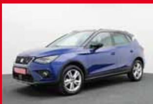
SEAT Arona FR 1.0 TSI, 85 kW (116 PS)

EZ 05.2019, 18.295 km , Abstandstempomat, DAB-Radio, Einparkhilfe Kamera, Induktionsladen für Smartph., LED-Scheinwerfer, Multifunktionslenkrad, Navi, Sitzheizung, Totwinkel-Assistent uvm.