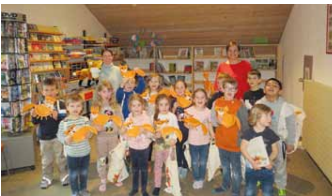
KiGa-Team St. Andreas, Kaldorf