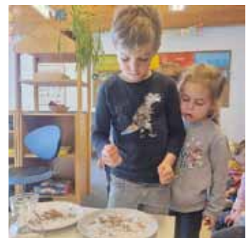
KiGa-Team St. Michael, Titting

Die Kinder der Sonnengruppe und Regenbogengruppe beschäftigen sich gerade in der Vorosterzeit mit dem Thema Kreuzweg. Passend zu diesem Thema haben die Kinder Kresse gesät – auch hier entsteht etwas Neues, so wie es im Kreuzweg bei der Auferstehung Christi passiert. Bis zum kommenden Osterfest kann die Kresse dann auf einem leckeren Butterbrot gegessen werden.