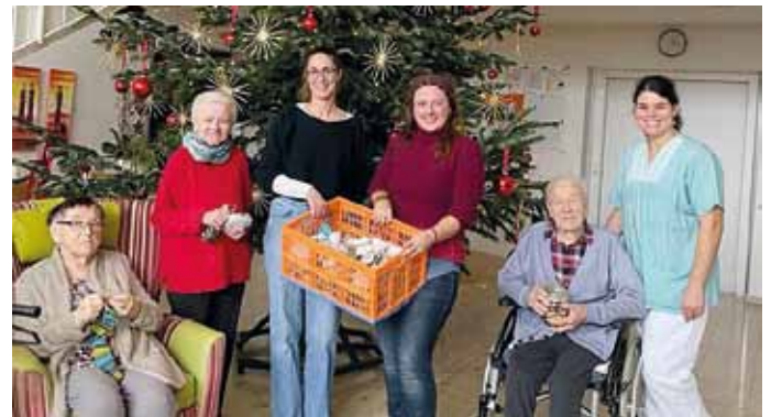
Fröhliche Plätzchen-Übergabe im Seniorenheim Anlautertal durch die Vorständinnen der Gartenfreunde Titting

Die Gartenfreunde Titting haben sich heuer dazu entschieden die übrigen Plätzchen-Päckchen vom Adventsmarkt-Verkauf aufgeteilt an die Mittagsbetreuung der August-Horch-Grund- und Mittelschule Titting und an die Bewohner/innen des Seniorenheims Anlautertal zu spenden.