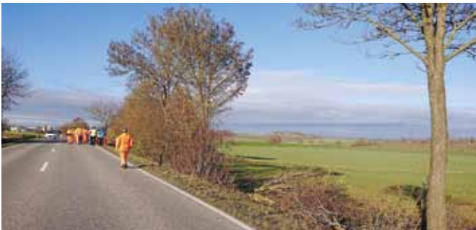
Korrekt ausgeführte Heckenpflege am 17. Grünseminar des Landkreises: Abschnittsweises auf den Stock setzen, Einzelbäume stehen lassen

Der Landschaftspflegeverband hat beim Grünseminar noch die Möglichkeiten einer geförderten Heckenpflege vorgestellt. In Titting haben wir mit dieser Art der Heckenpflege bereits begonnen und wollen das auch in den nächsten Jahren weiterverfolgen und ausbauen, um unsere Hecken als wertvolle Landschaftselemente zu erhalten.