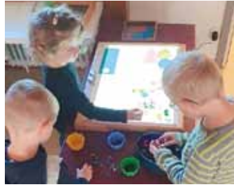
KiGa-Team St. Michael, Titting

Kurz vor den Ferien haben wir zwei Lichtspieltische für die Kinder angeschafft. Diese sind jetzt schon von der neuen Errungenschaft begeistert und nutzen sie gerne.