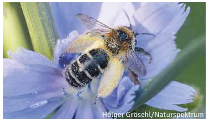
Die Wegwarten-Hosenbiene ist auf Korbblütler spezialisiert und sammelt ihre Pollen besonders gerne an der blaublühenden Wegwarte.

Als Übergangsbereiche zwischen Wiesen und Feldern sind sie ein wertvoller Rückzugsraum für viele Pflanzen- und Tierarten. Manche tragen dies sogar im Namen, wie die Feldweg- Schmalbiene und die blaublühende Wegwarte.