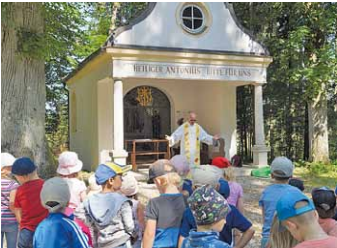
KiGa-Team St. Michael, Titting

Am letzten Tag gab es zum Abschluss für alle Kinder noch ein kleines Eis. Die Kinder haben schon gesagt, dass sie dieses Erlebnis nächstes Jahr wiederholen möchten.