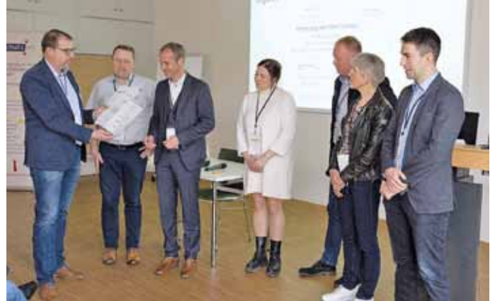
Verleihung des Zertifikates und des Prüfnachweises BSI Grundschutz auf der Bühne des IT-Sicherheitsclusters e.V. beim CISIS12-Infotag.

Autor und Kontakt: Ralf Turban, Mein-Datenschutzberater