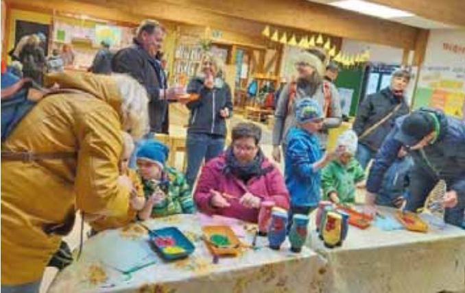
KiGa-Team St. Michael, Titting