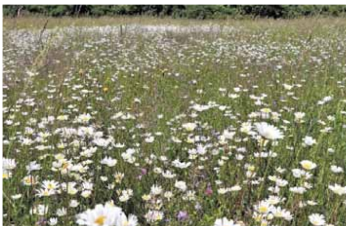
Margeritenblüte im Naturpark Altmühltal.