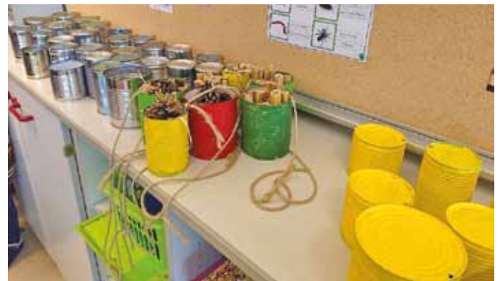
Text und Fotos: Katharina Hinterholzinger Projektmanagement Biodiversität, Markt Titting

Zusätzlich organisierten sie am Schulfest einen kleinen Eine-Welt-Laden-Stand und verkauften dort einerseits fair gehandelte Produkte, wie z.B. Kaffee, Schokolade und Reis der Fair-Trade-Marke GEPA sowie kleine Geschenk- und Dekoartikeln. Zum anderen konnte man Taschen und Hefteinbände aus alten, aussortierten Landkarten der Schule Titting erstehen.