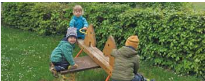
KiGa-Team St. Andreas, Kaldorf