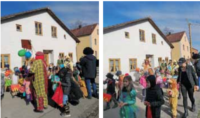
KiGa-Team St. Michael, Titting

Wir möchten uns bei allen Eltern bedanken, die uns mit ihren Kindern so fleißig begleitet haben und freuen uns schon auf den nächsten Fasching.