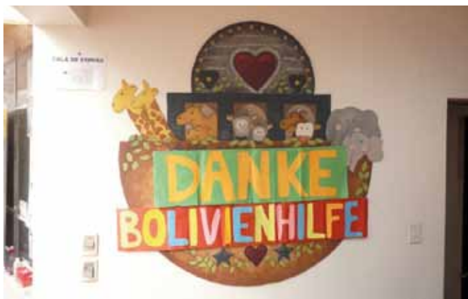
Die Kinder in Bolivien sagen bereits jetzt MUCHAS GRACIAS!

Daneben haben wir noch eine spezielle Bitte: Wenn Sie selbst nicht gerade auf der Strecke unterwegs sind, suchen wir noch engagierte Helfer:Innen, speziell für die