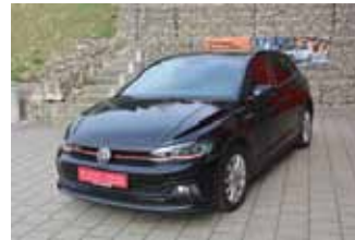
VW Polo GTI DSG 2.0 TSI, 147 kW (200 PS)

EZ 02.2020, 17.904 km, Navigationssystem Discover Media, LM-Felgen 17", LED Scheinwerfer, Klimaautomatik, Sitzheizung vorne, Parksysteem vorne und hinten inkl. Rückfahrkamera, TOP Sportsitze vorne, uvm.