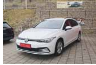
VW Golf 8 Variant Life 1.5 TSI, 110 kW (150 PS)

EZ 08.2021, 23.895 km, Anschlussgarantie 2 Jahre max. 80.000 km, Navigationssystem Discover PRO, LM-Felgen 16", Parksysteem vorne und hinten, Business Paket Premium, Sitzheizung vorne, LED Scheinwerfer, uvm.