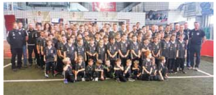
Die Vorstandschaft der DJK Limes 09