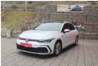
VW Golf 8 GTI DSG 2.0 TSI, 180 kW (245 PS)

EZ 03.2021, 9.150 km, Navigationssystem Discover Media, Panoramastiebedach, LED Scheinwerfer, LM-Felgen 19", ACC Abstandstempomat, Parksysteem vorne und hinten, Klimaautomatik, uvm.