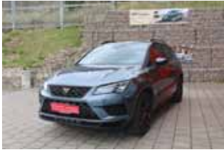
CUPRA Ateca 4Drive DSG 2.0 TSI, 221 kW (300 PS)

EZ 01.2019, 57.366 km, Panoramadach, Navigationssystem, LM-Felgen 19", 360° Kamera, Parklenk-Assistent mit Parksysteem vorne und hinten, Winterpaket, Black Package, LED Scheinwerfer, uvm.