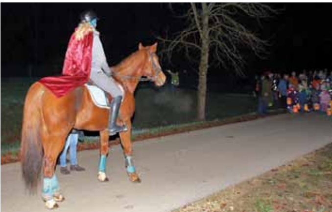
KiGa-Team St. Andreas, Kaldorf

Allen die zum Gelingen des schönen Martinfestes beigetragen haben ein herzliches Dankeschön!