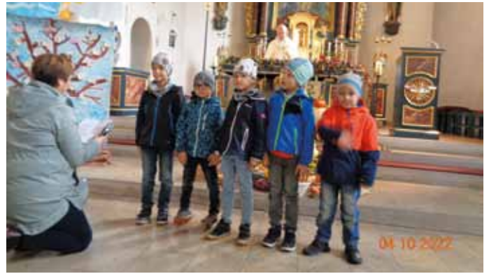
KiGa-Team St. Michael, Titting