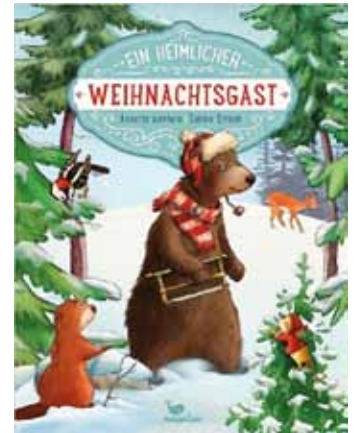
Das Team der Bücherei